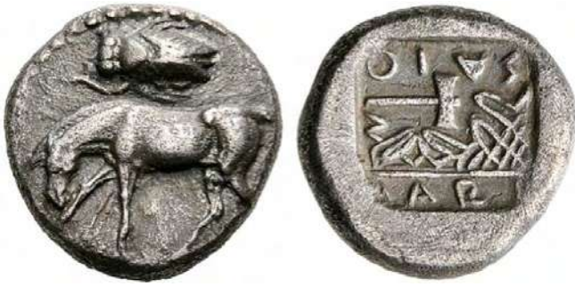
Εικόνα 1. Νομισματοκοπείο Λάρισας, 5ος-4ος αι., π.Χ., Αργυρή δραχμή. Οβολός. Kagan2004, 85, 1.1.