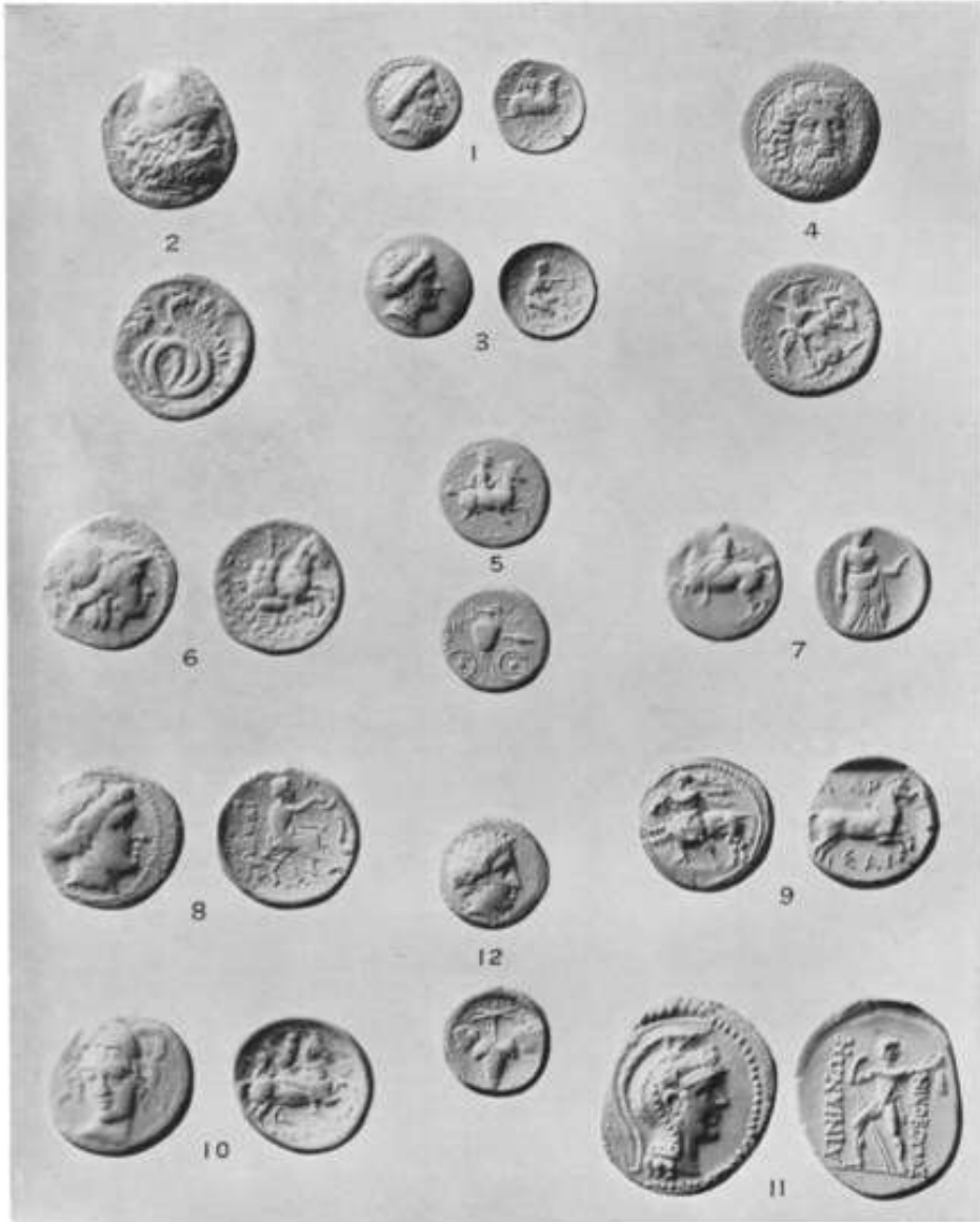
XVI. COINS OF THESSALY

The British Museum Quarterly, Vol. 1, 1933, 49-50