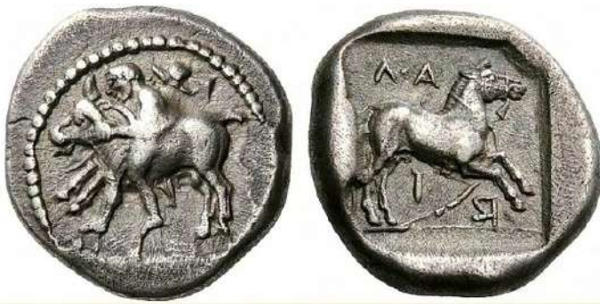
Εικόνα 4. Λάρισα, 460 – 440 π. Χ., ελλειποβαρής αργυρή δραχμή, 5,36 γρ. Εμπρός, σκηνή ταυροκαθασιών. Θεσσαλός βηματίζει προς τα αριστερά. Έχει πέτασο πάνω από τους ώμους και χλαμύδα δεμένη από το λαιμό. Κρατά ταινία πάνω από το μέτωπο του ταύρου, που ορμά προς τα αριστερά. Όπισθεν, ΛΑ-Ρ-Ι. Άλογο με χαλινάρι συρόμενο προς τα δεξιά, σε έγκοιλο τετράγωνο. Lorber 2008, 41. 9.