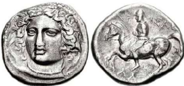
Εικόνα 6. Λάρισα. 380 - 365 π. Χ., αργυρή δραχμή, 6,06 γρ. Εμπρός κεφαλή της νύμφης Λάρισας στραμμένη 3/4 προς τα αριστερά. Φορά περιδέριο στο λαιμό και διακριτική ταινία στα μαλλιά. Όπισθεν, ΛΑ-Ρ-ΙΣΑΙ-ΩΝ, νεαρός θεσσαλός ιππέας με κράνος, θώρακα και κοντό χιτώνα καλπάζει προς τα αριστερά.